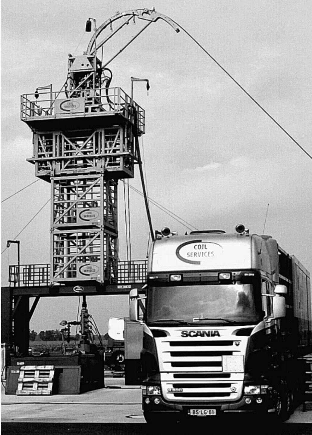
Ab in die Tiefe: In Oppenwehe laufen die Probebohrungen nach Erdgas bereits.

In NRW kann von einer solchen Gefahr keine Rede sein. Kein Unternehmen hat bislang die Genehmigung, Shale-Gas zu fördern, egal mit welcher Methode. Auch in Oppenwehe laufen bislang nur Testbohrungen. Ab Mitte November will Exxon versuchen, Risse im Untergrund zu erzeugen, um Fließwege des Gases zu ermitteln.